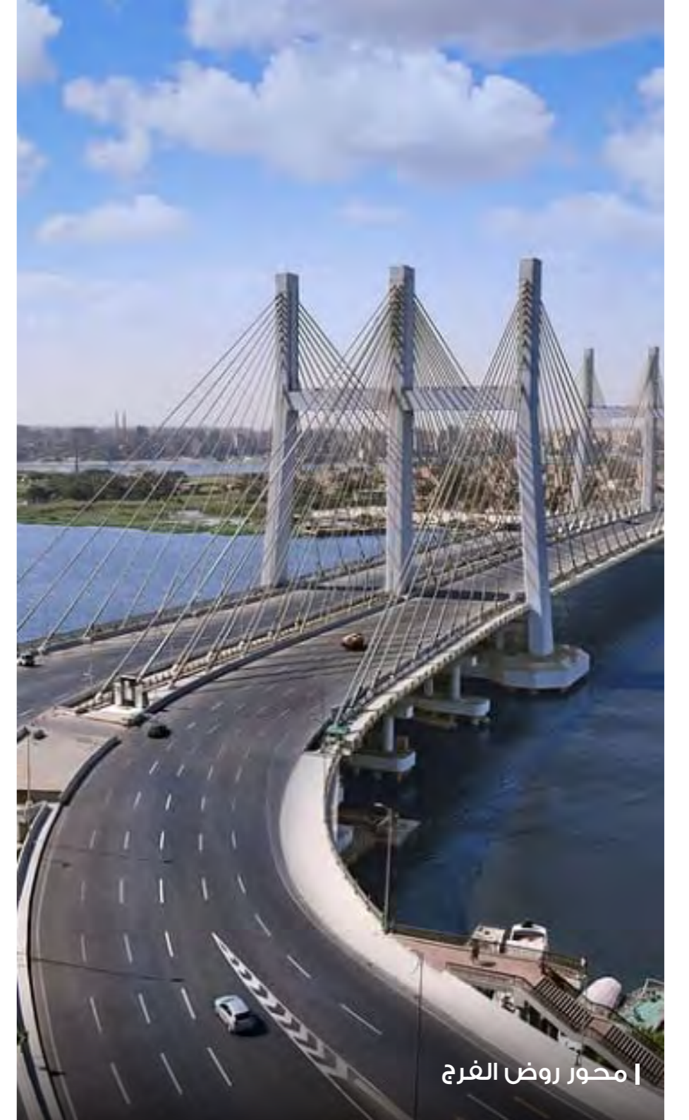
محور روض الفرج

تلتزم ترانزأوشن منذ نشأتها بأقصى درجات الجودة لمنتجاتها؛ والسعي الدائم للوصول إلى أسواق جديدة، مما أدى إلى أن تصبح مؤسسة عالمية متميزة بتوريد منتجات متخصصة عالية الجودة طبقاً للمعايير العالمية.