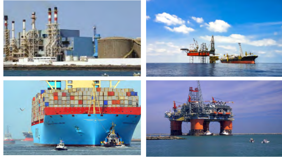
مشاريع كبرى لطلاء وتهيئة خزانات الغاز و العديد من السفن

وبذلك تقوم ترانزأوشن بالتعاون مع الشركات الكبرى في السوق المصري وكذلك مع شركاء مرموقين في الأسواق اللبنانية والسورية والنيجيرية.